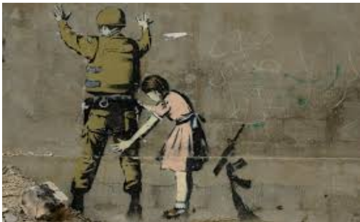
La Petite Fille et le Soldat - Banksy

Suivant le fil rouge de contes initiatiques, racontés et revisités par la sœur aînée, Mike Kenny nous entraîne, avec un grand suspense, et de l'humour, sur les traces de ces trois sœurs et de leur découverte de la liberté.