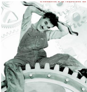
Les Temps modernes Charlie Chaplin