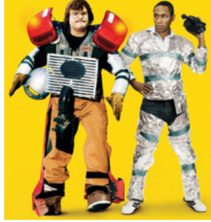
Soyez sympas, rembobinez Michel Gondry