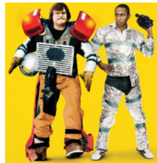
Soyez sympas, rembobinez Michel Gondry