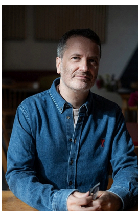
Clément Poirée © Fanchon Bilbille

“Il est fort intrigant de se plonger dans la pièce de Molière et d'ausculter le caractère qu'il met en jeu ; où en sommes-nous aujourd'hui de l'avarice ? Ce qui fut un terrible défaut, une maladie de l'âme, a pris des colorations plus positives à l'ère de l'économie circulaire et de la croissance. Au fond, on ne peut que souscrire aux propos d'Harpagon quand il reproche à son fils de s'habiller de façon somptuaire (il porte l'équivalent de 5000 euros de vêtements sur le dos tout de même !). À l'époque de la chasse au gaspillage, comment ne pas le comprendre notre « avare » quand il demande à ses domestiques de servir les gens selon leur faim plutôt que de les inciter à consommer démesurément ? Lutte contre le gaspillage, seconde main, économie circulaire, sobriété, etc. font aujourd'hui partie de notre pensée sur la dépense et l'épargne, la générosité et l'avarice.”