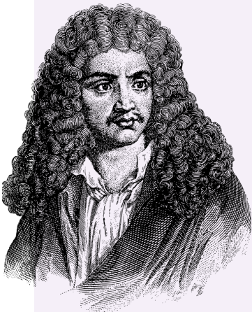
Portrait de Molière

Molière, de son vrai nom Jean-Baptiste Poquelin, est un dramaturge, comédien metteur en scène et directeur de troupe né en 1622 et mort en 1673. Il bénéficie de la protection de Louis XIV, qui cherche à attirer des artistes à la cour. C'est ainsi que Molière reçoit une gratification financière de la part du roi, et compose des pièces commandées par celui-ci pour faire rayonner son pouvoir. Molière écrit 33 pièces de théâtre et grâce à la protection royale et à son talent, il connaît le succès et la richesse de son vivant. Cependant, L'Avare, qui est mis en scène pour la première fois en 1668, ne rencontre le succès qu'au XIXe siècle, bien après la mort du dramaturge. Elle deviendra sa deuxième pièce la plus jouée, et est considérée comme le modèle par excellence des comédies de Molière.