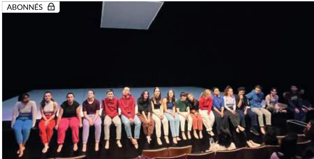
Les élèves de Sarsan en "récréation" avec Dans6t.