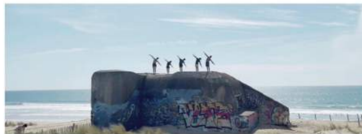
Par Matis Leggiadro

Le début de l'œuvre joue beaucoup sur la symétrie, l'harmonie ordonnée, car elle est la pire des contraintes. Seulement, quelques déséquilibres se font voir, très subtils et maîtrisés. Un tableau m'a marqué : de dos, les six danseurs deviennent des oiseaux migrants, ou bien des avions qui évitent le crash, on ne serait dire exactement. Les bras sont tendus horizontalement et les corps basculent à droite puis à gauche puis à droite puis à gauche. C'est pur, c'est simple et c'est tellement bauschien !