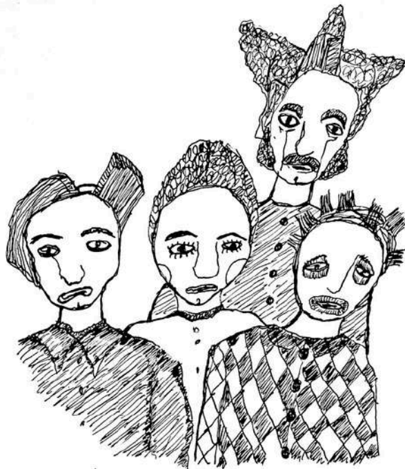
Les Masques de l'éboudi

MASQUES EN TISSUS LELIE LEANDRE ANSELME MASCARILLE